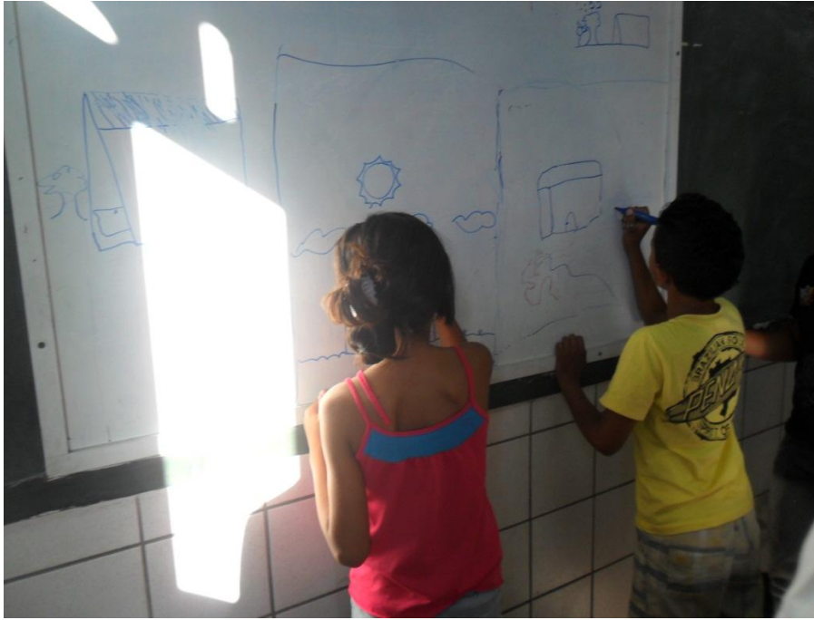
Figura 06

Diante disso, estes mapas podem trazer coisas efêmeras e as problemáticas sociais num simples rabiscar da criança. Notamos que diante das transformações do espaço que estas obras cartográficas são únicas. Se o estudante for representar outra vez a paisagem que ele tinha mapeado, não será a mesma. Outros detalhes aparecerão que não estavam presente no primeiro rabiscar, outro panorama será visto, outra tema/problemática aparecerá, outros sentimentos aparecerão ao observar essa paisagem e com isso outros mapas virão em sua mente. Isso acaba tornando o trabalho tão valioso, pois é único.