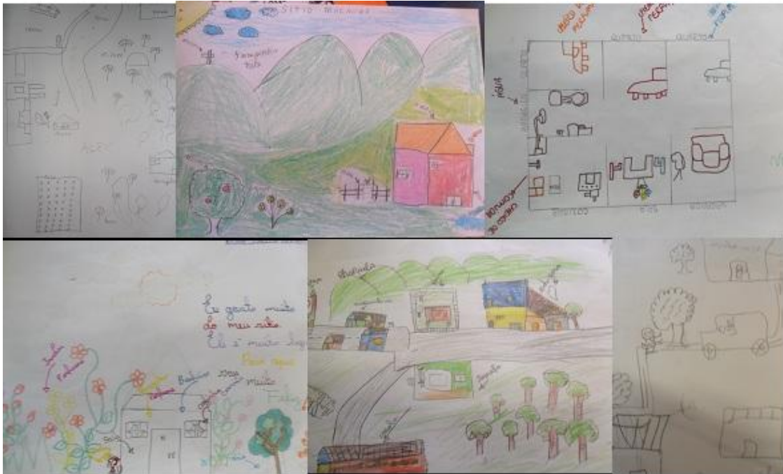
Figura 05 – Foto: PEREIRA, C. E. G.

A mente dos estudantes é surpreendente, pois eles traçam as características típicas que estão nos seus pensamentos, podendo ser real ou somente na sua imaginação fecunda. Podemos ver nessas representações olhares diferentes da Chapada do Araripe, que tem forma de relevo tabular lembrando uma mesa, desenhada como uma montanha. Ainda podem-se encontrar em trajetos desenhados elementos como corações, flores, árvores, currais, aves, porcos, carros, campos de futebol e outros símbolos que libertam a história de sua vida. Os estudantes recriam mapas dos locais que já vivenciaram, não seguindo nenhum dos padrões cartográficos para representar o que observam, e utilizando apenas o seu método de percepção.