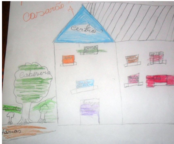
Figura 03

Pode-se ver no mapa como o rural é colorido em verde, com árvores e a terra. Em contrapartida, na zona urbana da cidade se encontram casas e casarões antigos. Se analisarmos os mapas nas suas entrelinhas poderemos observar a questão de dependência da zona do centro da cidade. Esse exemplo ilustra bem como as representações poéticas e imagéticas feitas pelos estudantes, mesmo sem a intenção, estão carregadas de preceitos e preconceitos.