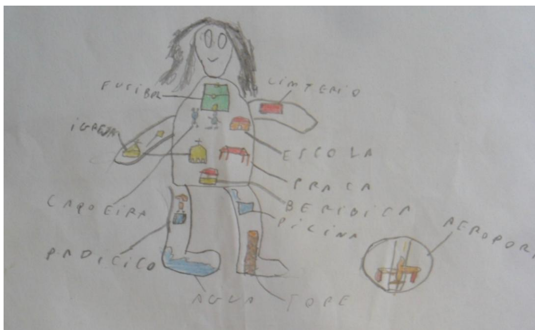
Figura 01 – Foto: PEREIRA, C. E. G.

Nos primeiros dias dos projetos foram expostos algumas técnicas e recursos para que os alunos produzissem mapas mentais do município, nos quais representariam o município de um modo primoroso e original. E destes mapas vieram algumas coisas interessantes, que vale aqui expor. No mapa da figura 01 nota-se uma representação de um menino com vários monumentos de uma paisagem dentro do seu corpo. Podemos então notar que o aluno traçou somente a paisagem do sítio onde ele mora, zona rural de Barbalha, em seu corpo. Podemos ver as suas emoções transpassadas, pois como ele próprio falou: “coloquei em meu corpo locais marcantes do município”. Porém, algumas questões ainda não ficaram claras como, por exemplo, por que o aeroporto está fora do seu corpo-território.